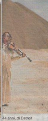
44 anni, di Detroit

ter non rinnega mai il solido sostegno del jazz più tradizionale, evocando gli arabeschi espressivi degli anni Trenta e Venti.