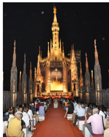
Concerto del luglio 2009 Duomo di Milano: "Il Canto delle Guglie" dal progetto ASCOLTARE LA CATTEDRALE

L'orchestra è composta da musicisti che ne condividono lo stile e gli obiettivi, provengono da prestigiose formazioni nazionali ed internazionali come la Filarmonica Toscanini, il Maggio Musicale Fiorentino, il Teatro alla Scala di Milano e si avvale della collaborazione di alcune prime parti ospiti provenienti da compagini di eccellenza internazionale quali l'Orchestra del Festival di Bayreuth, i Bayerischer Rundfunk, la NDR di Amburgo.